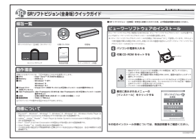
クイックガイド (本書)