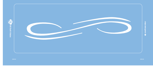
SRソフトビジョン (全身版) (センサシート)