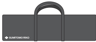
キャリングバッグ